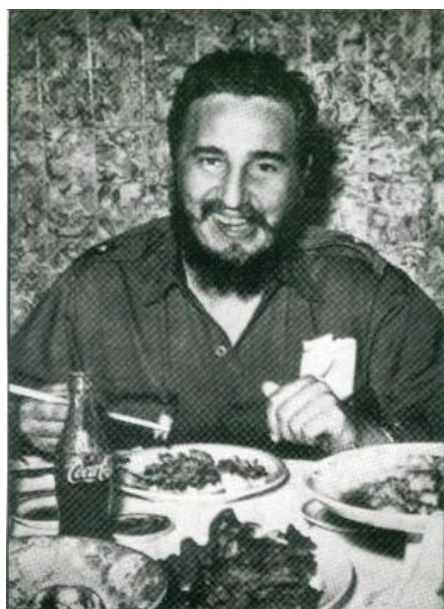
El Comandante Fidel Castro en el Restaurante El Pacífico, a principios del triunfo de la Revolución cubana.